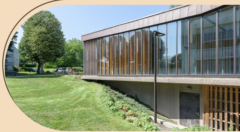
Lycée Amiral Ronarc'h