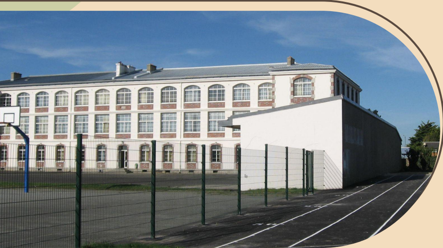
Collège Les Quatre Moulins